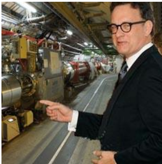
Рис. 1. Фотоколлаж: Том Хэнкс и БАК

О своем согласии известный актер заявил директору по технологии и ускорителям БАК Стиву Маиерсу, который лично проводил экскурсию для Хэнкса по территории коллайдера. Хэнкс посетил ускоритель в рамках рекламной кампании фильма, в котором он исполняет роль профессора Роберта Лэнгдона. Герой Тома Хэнкса оказывается втянут в сложную интригу, в которой участвуют представители Ватикана, ученые, а также 0,25 грамма антиматерии.