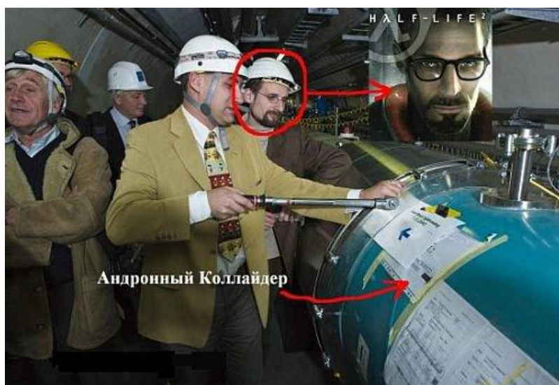
Рис. 4. Физик, напоминающий персонажа игры HL-1

В 2008 году интересная версия появилась на ряде сайтов о том, что на самом деле шума вокруг БАК создана вовсе не CERN.