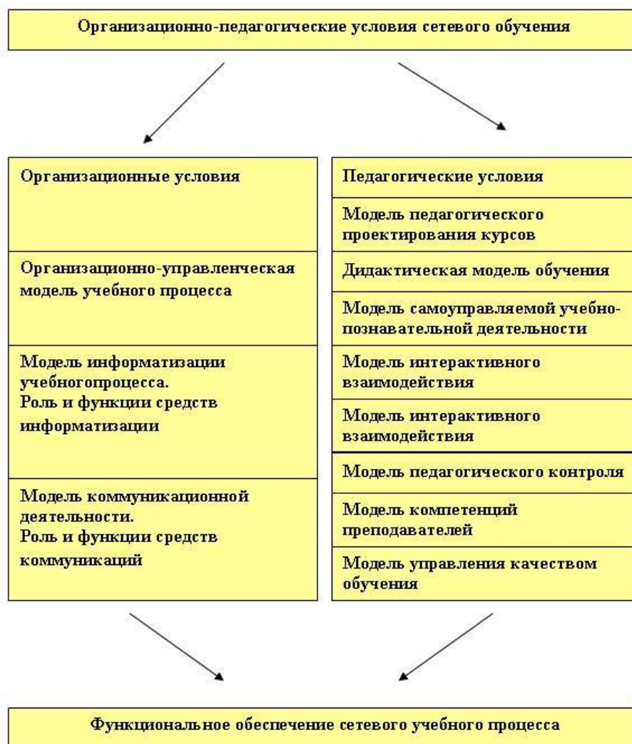
Рис. 3. Организационно-педагогические условия сетевого обучения