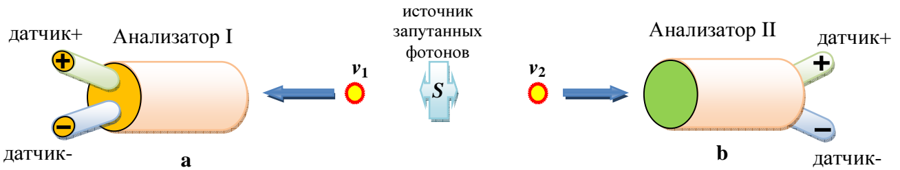
Рис.2 Мысленный эксперимент Эйнштейна-Подольского-Розена с фотонами (подобие схемы, взятой из работы Алена Аспекта). Два фотона \nu_1 и \nu_2 , испускаемые источником S , проанализированы линейными поляризаторами в направлениях \mathbf{a} и \mathbf{b} .

обоснования на примере мысленного эксперимента Эйнштейна-Подольского-Розена (эксперимента ЭПР). В слегка изменённом виде этот эксперимент можно изобразить следующим образом: